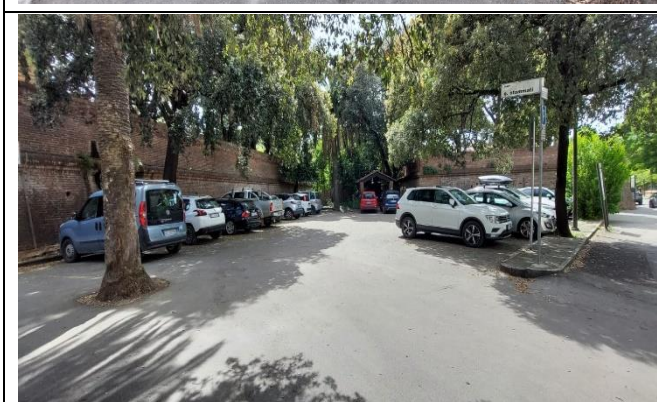
Foto 1 e 2 san Francesco, stalli dedicati a persone con ridotta mobilità Foto 3,4,5 inizio corso Carducci (fuori le mura) stalli dedicati a persone con ridotta mobilità. Foto 6, inizio corso Carducci accanto banca MPS, stalli dedicati a persone con ridotta mobilità Foto 7, parcheggio pubblico a pagamento inizio corso Carducci (fuori le mura)